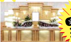
家族葬用 祭壇一式