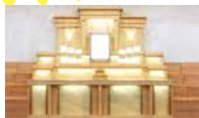
家族葬用 祭壇一式