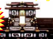
一般葬用 祭壇一式