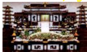
一般葬用 祭壇一式