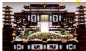
一般葬用 祭壇一式