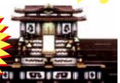
一般葬用 祭壇一式